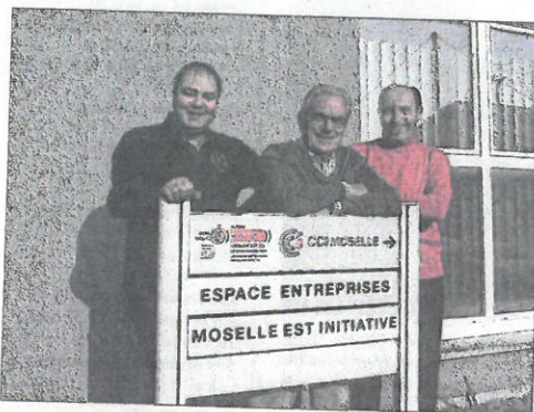
Les responsables de la plateforme pour l'emploi de Moselle-Est invitent les jeunes créateurs à monter des projets.